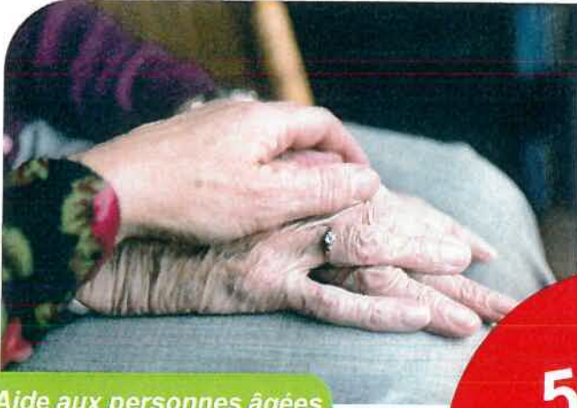
Aide aux personnes âgées