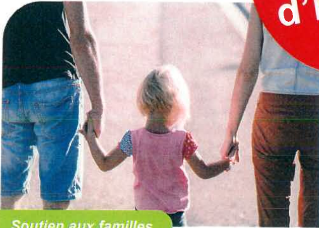
Soutien aux familles